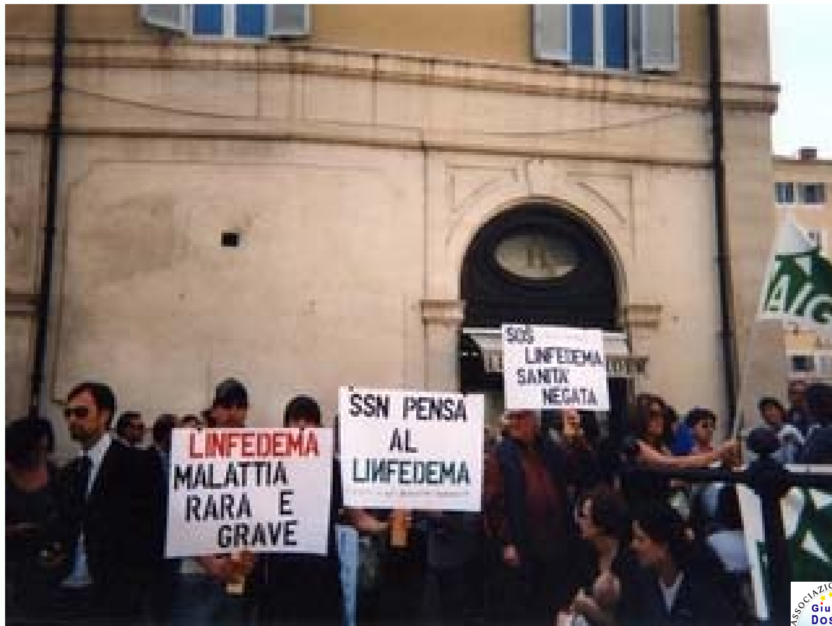
Camera dei Deputati - Palazzo Marini - Roma - 29 febbraio 2008